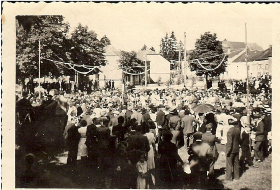
Une des premières fancy-fair