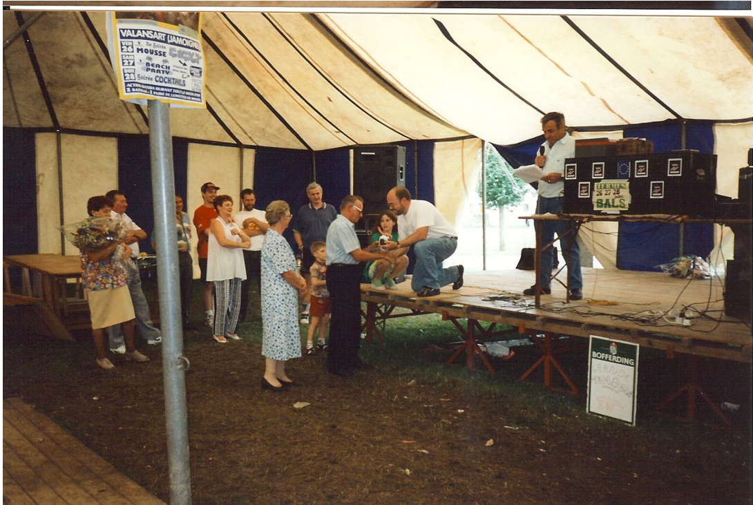
Préparation de la fancy-fair 2002